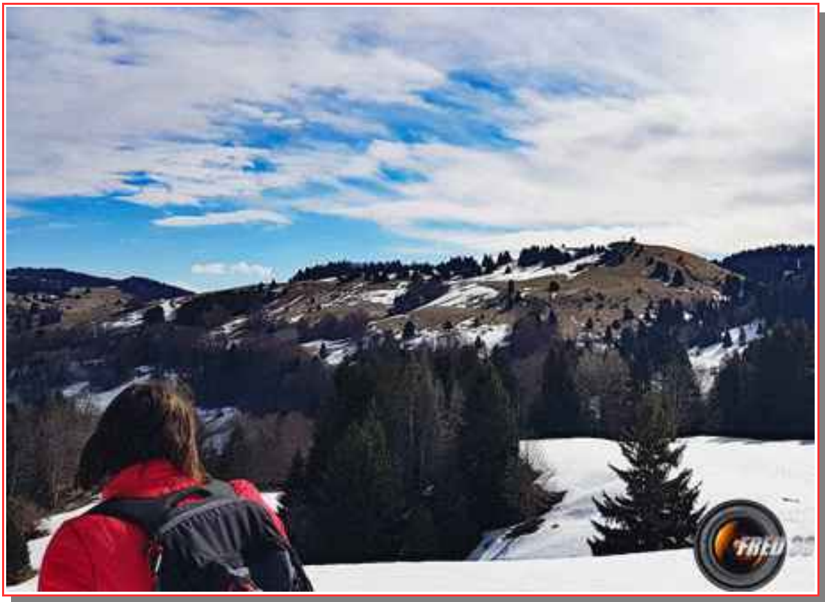
La Croix des Bergers vue des chalets de Crolles.