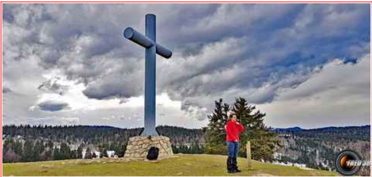
La grande croix métallique du sommet.

Itinéraire pour le sommet 11 km, 465 m de dénivelé positif.