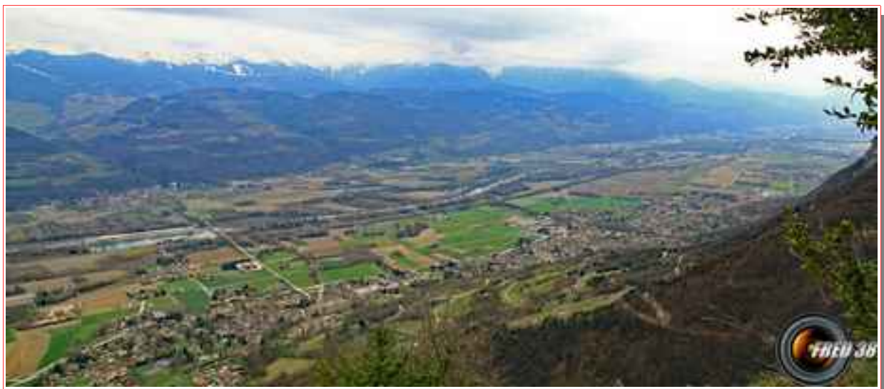
Le sommet et en fond la Grande Sure.