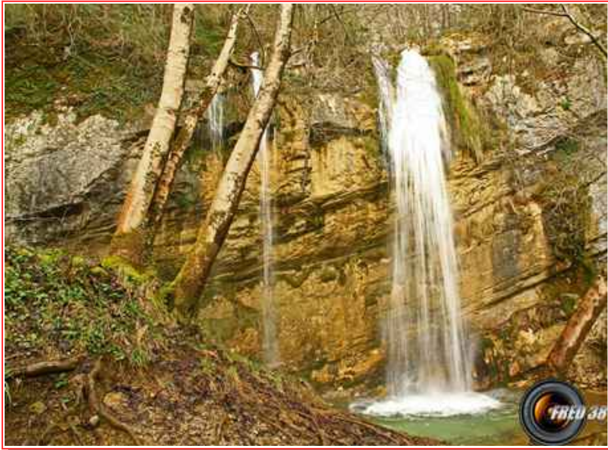
Une des cascades du Grésy.