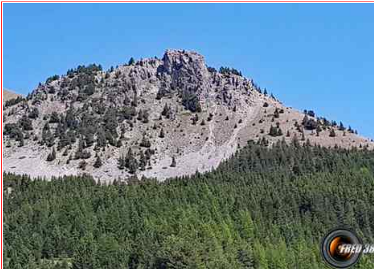
Le "Chateau" vu en cours de montée.