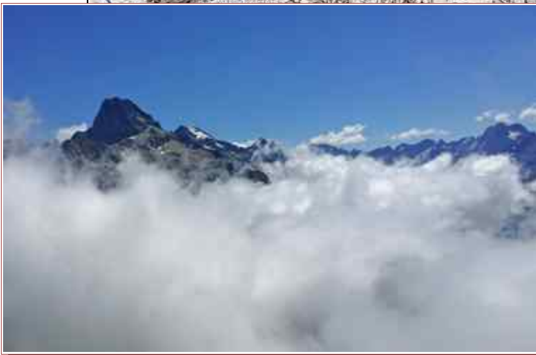
L'Olan et les Ecrins vu du col.