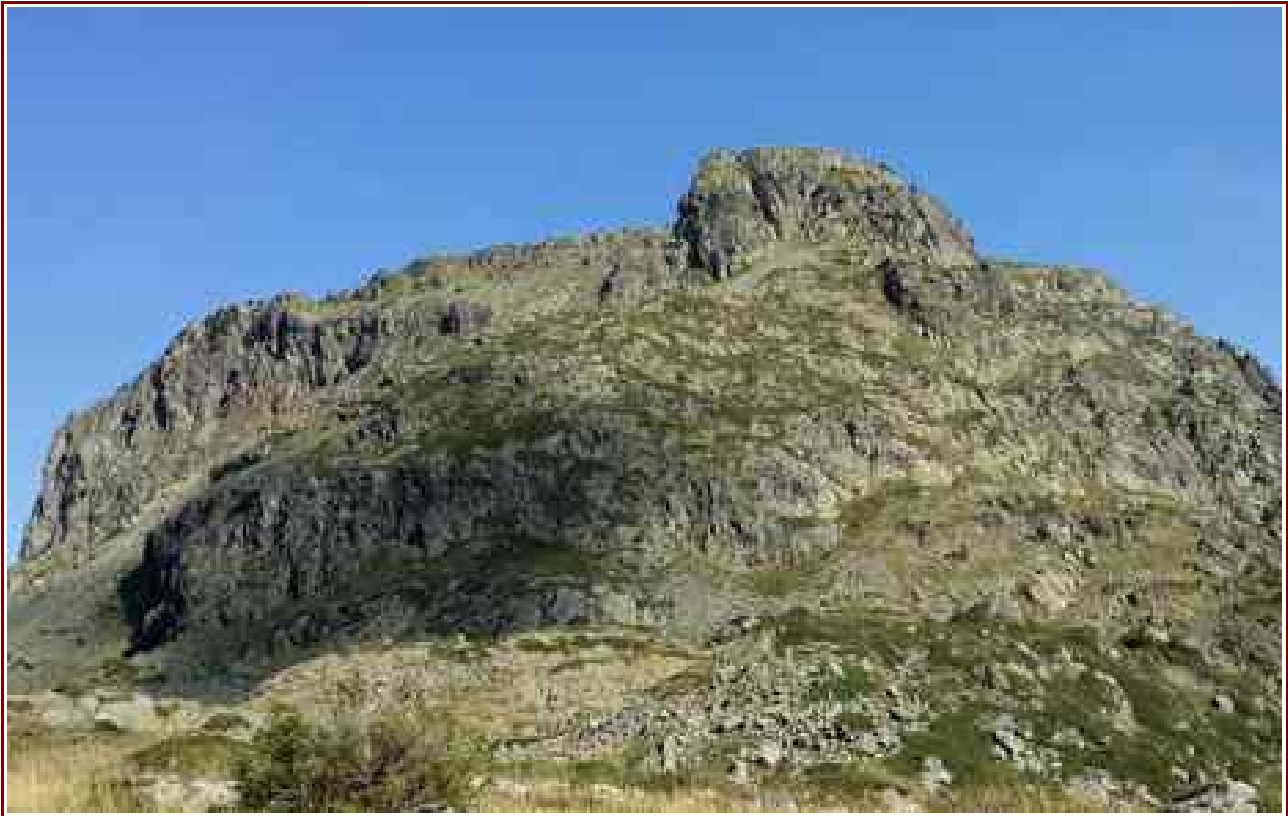
Le sommet vu des lacs Robert