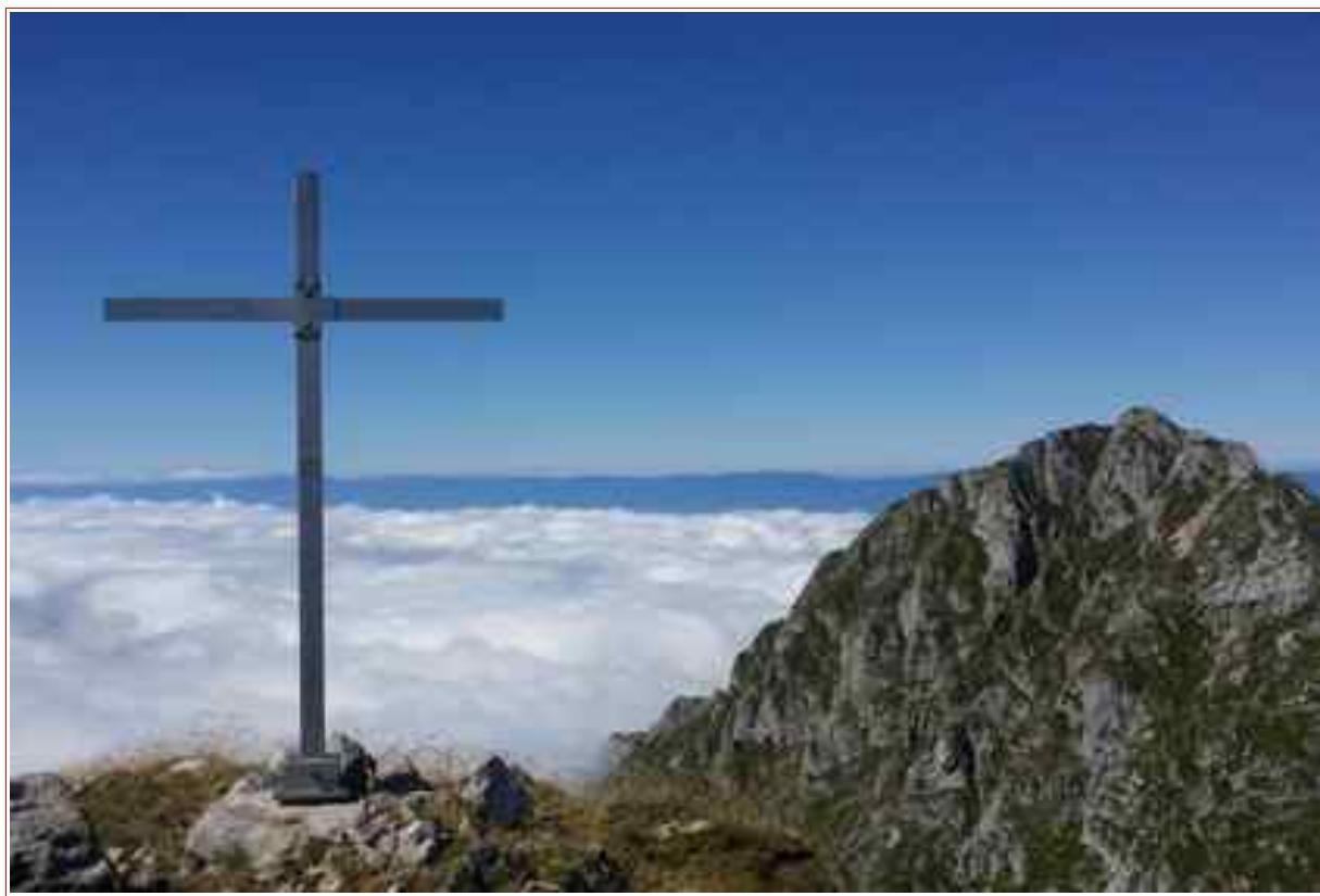
L'une des 2 croix du sommet, et en fond la dent d'Oche.