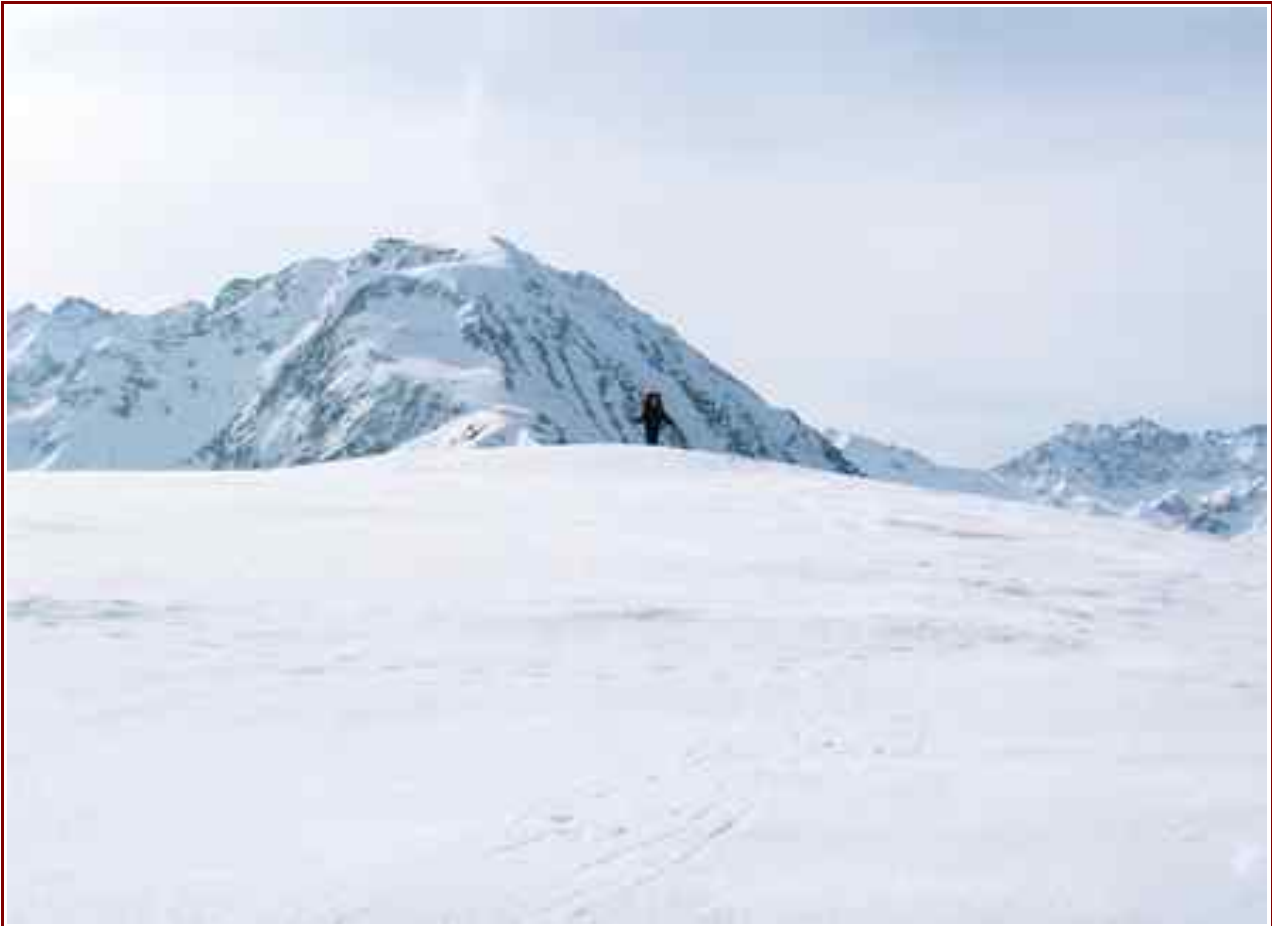
Le sommet du Chapotet et en fond le Grand Charnier