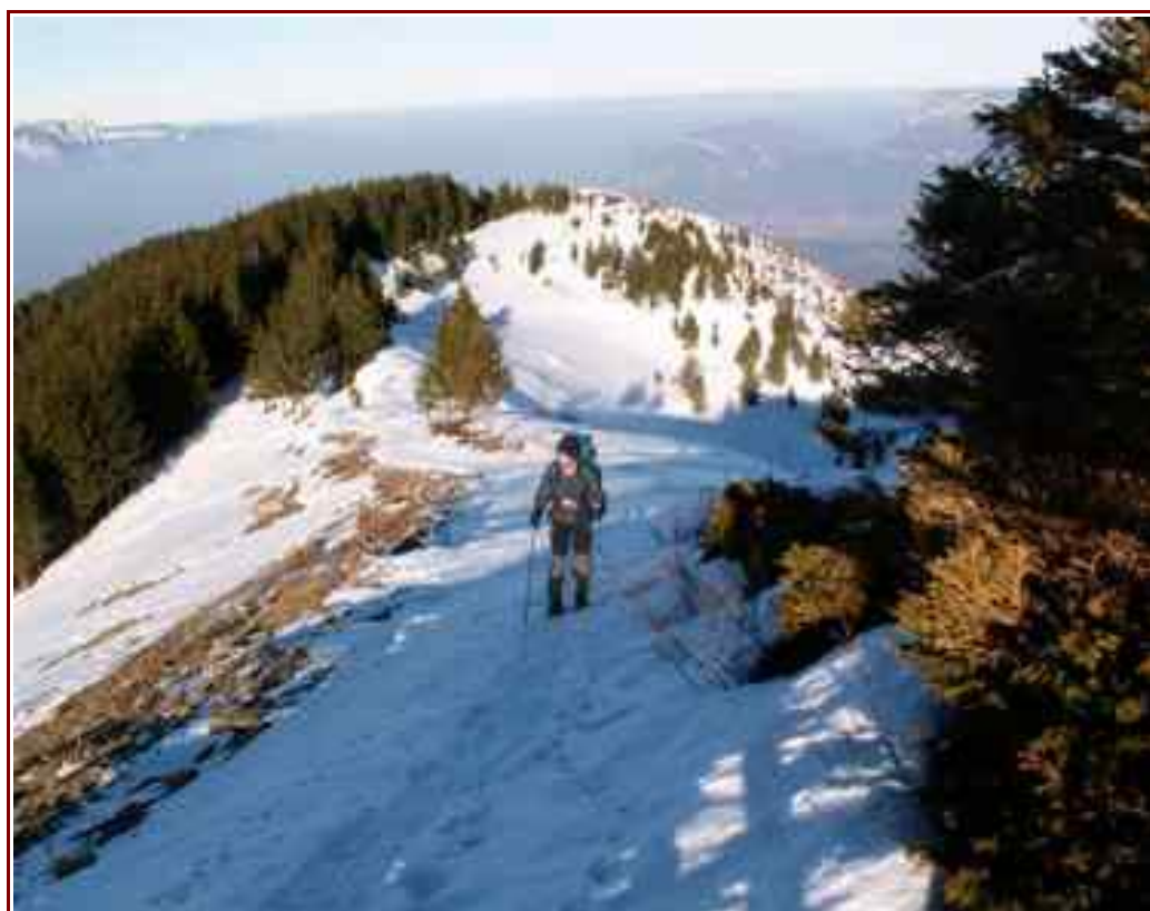
La crête conduisant au sommet