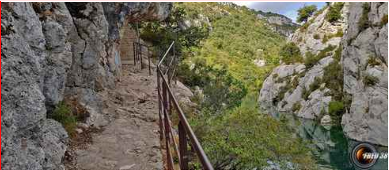
Le cheminement du sentier au dessus du Verdon.