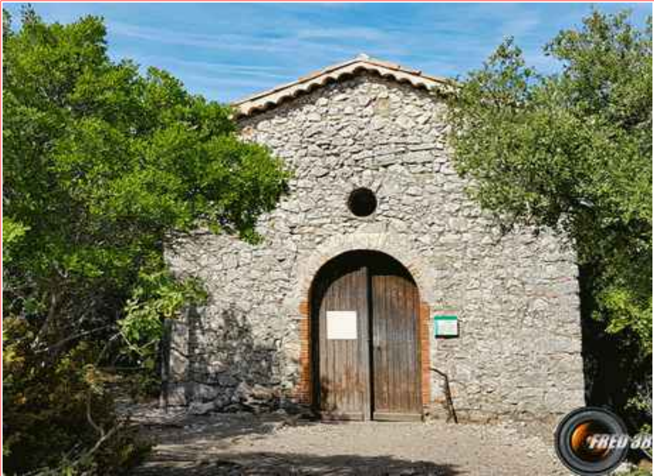
La Chapelle Saint-Maxime.

MASSIF : Pré-Alpes de Haute Provence CARTE : IGN 3343 OT