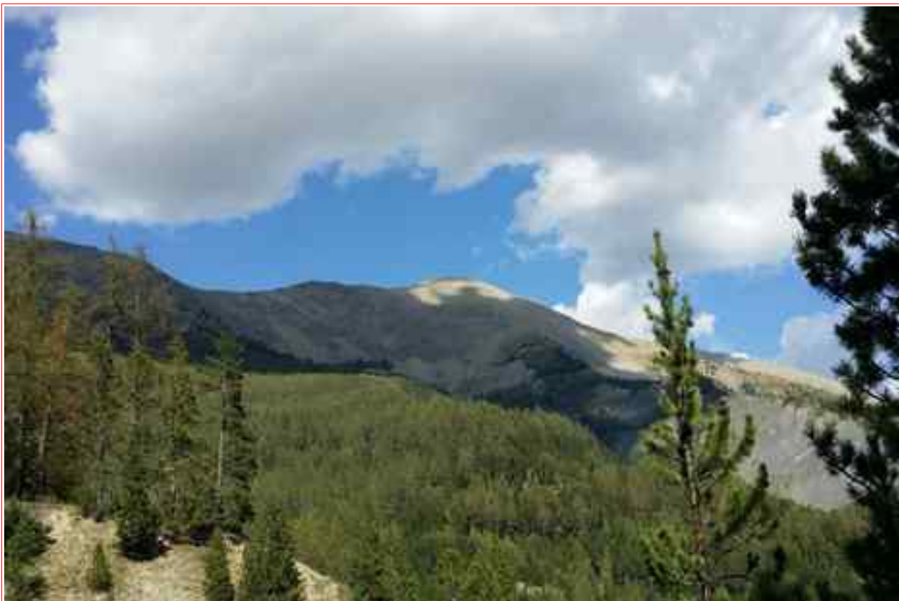
Le sommet vu du parking à 1600 m