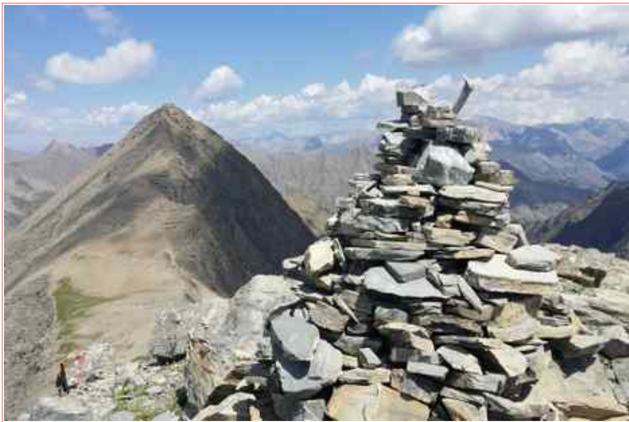
Le sommet et en fond le Grand Bérard