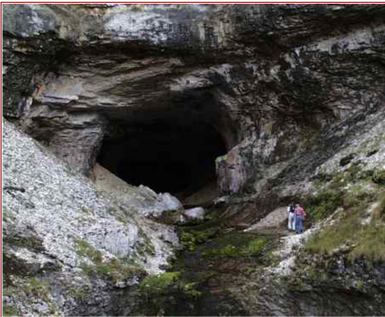
L'entrée de la grotte