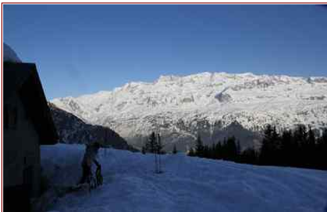
Massif des Grandes Rousses en fond