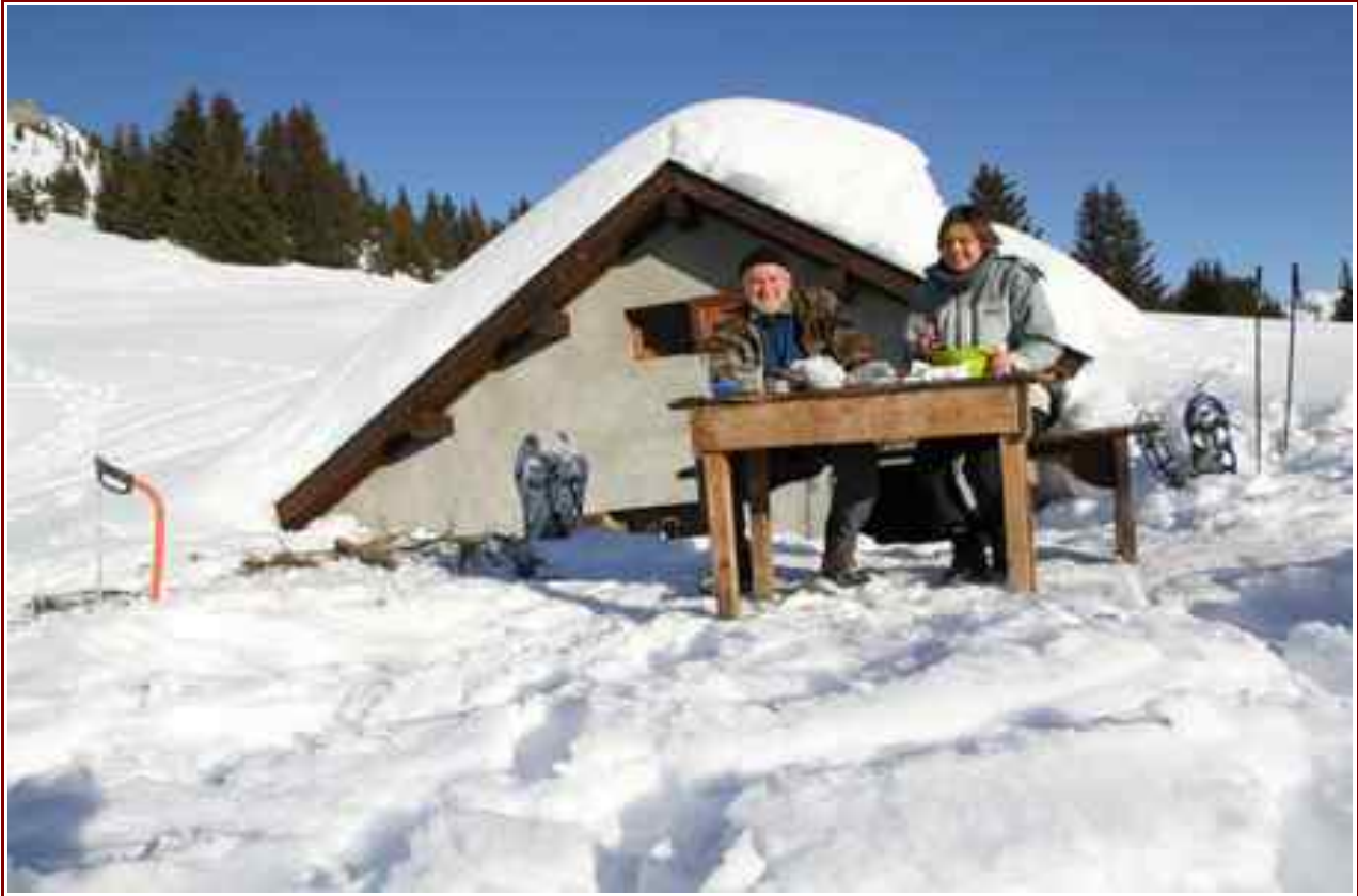
Petit déjeuner devant la cabane