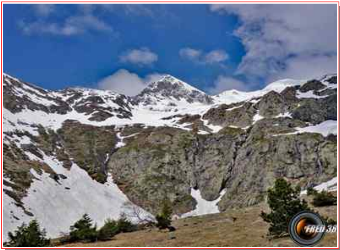
Combe de la Pisse.

Itinéraire 7 km (a/r), pour 940 m de dénivelé positif.