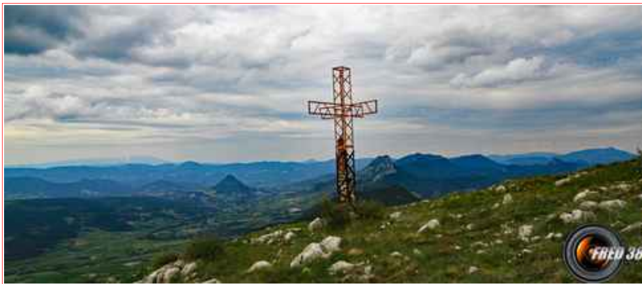
Le sommet et sa grande croix métallique.

Itinéraire pour le sommet 12 km, 800 m de dénivelé positif.