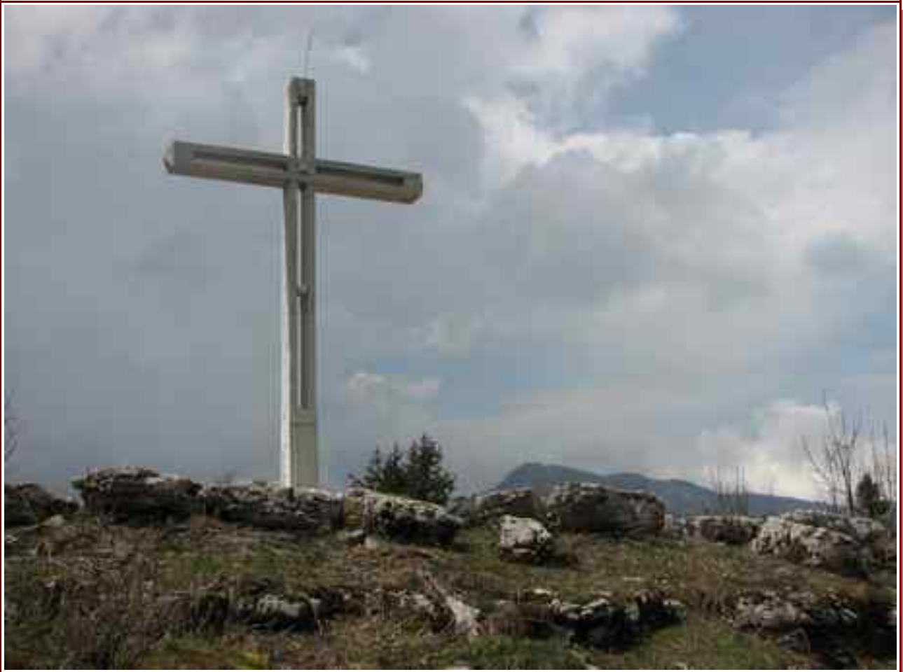
La croix du sommet