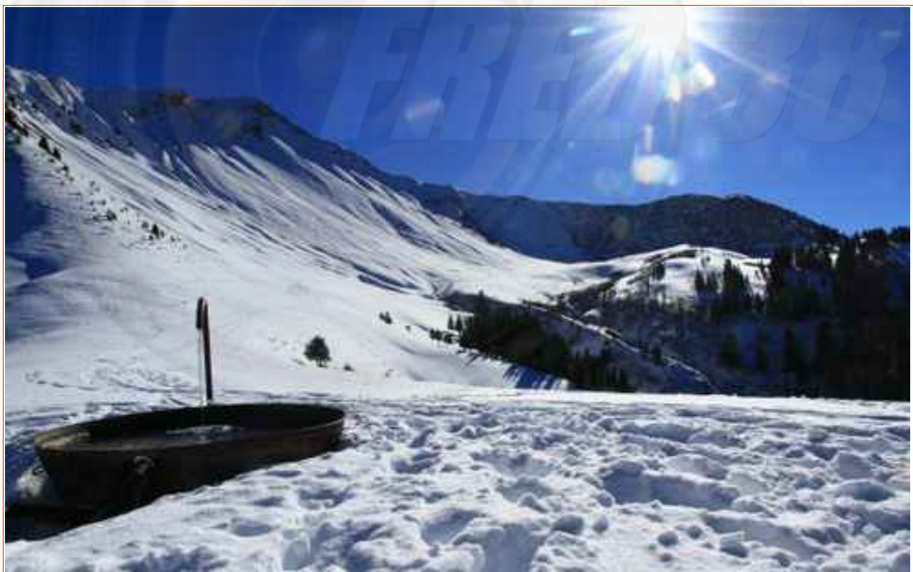
La fontaine, et à gauche la pointe de la Sambuy