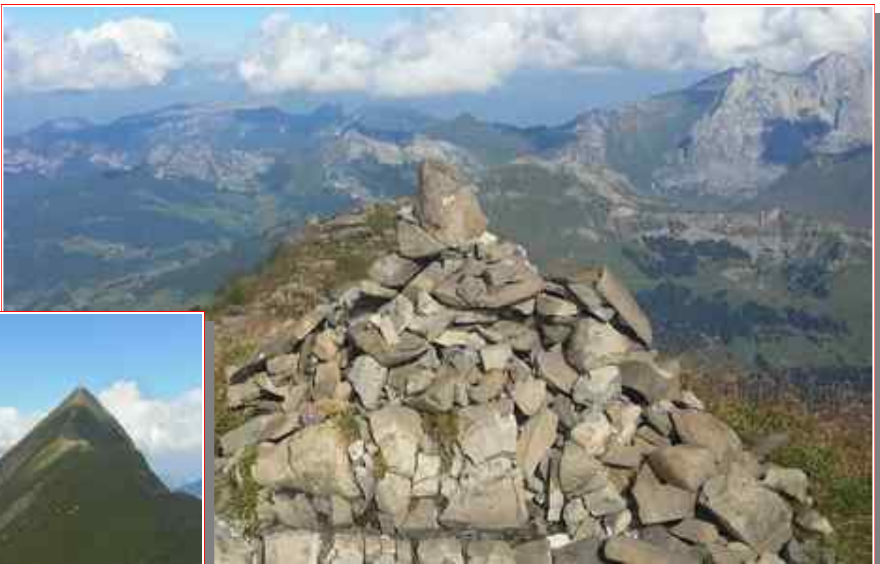
Le sommet, et le Jalouvre à droite.