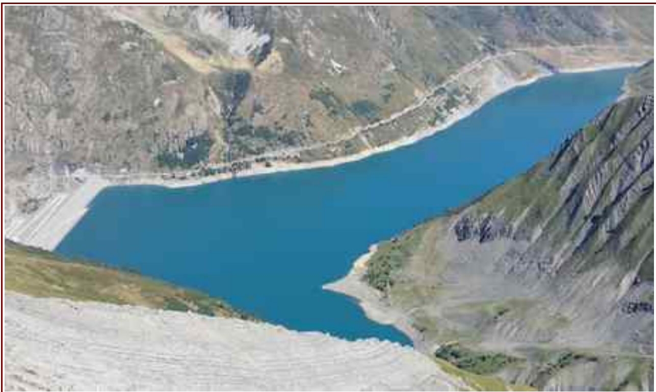
Le lac et le barrage de Grand Maison.